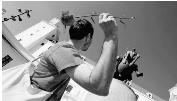
Dvaja výtvarníci sa na protest proti soche nechali postriekať červenou farbou, ďalší ju zahádzali červenými karafiátmi.

„Obnovené čestné nádvorie dostalo pôvodný barokový charakter a priestorová mierka. Z architektonicko-pamiatkového hľadiska je absolútne nepri-